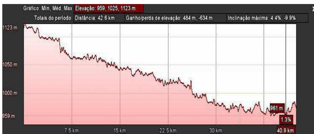
Figura 1- Perfil de elevação do Google Earth.

A suavização foi desenvolvida através da opção “adicionar linha de tendência”, do tipo “média móvel” e ajustada com 55 pontos. Com a suavização obteve-se a curva ajustada, que forneceu os dados de comprimento dos trechos com declive constante e os dados de altitude dos